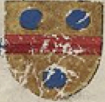
Les Grandes Chroniques de France parchemin

feme a plusieurs autres la cite fu arse a destruite le peuple il les barons occis mais aucuns eschaperent de celle pe silence a plusieurs des princes de la cite qui seppandirent en diuerses parties du monde pour querir nouvelles ba d'auens l'ense helenus encaus a arborer a maine autres arli helenus sur li vint des filz au roy puant si eueu poeres bons deus aut. et en mena avec lui des esilles de trois en greece son alaou deuie pandace de lui viffi pour gire l'ense Encaus qui desu des plus mis