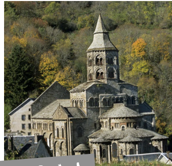
Notre-Dame d'Orcival art roman