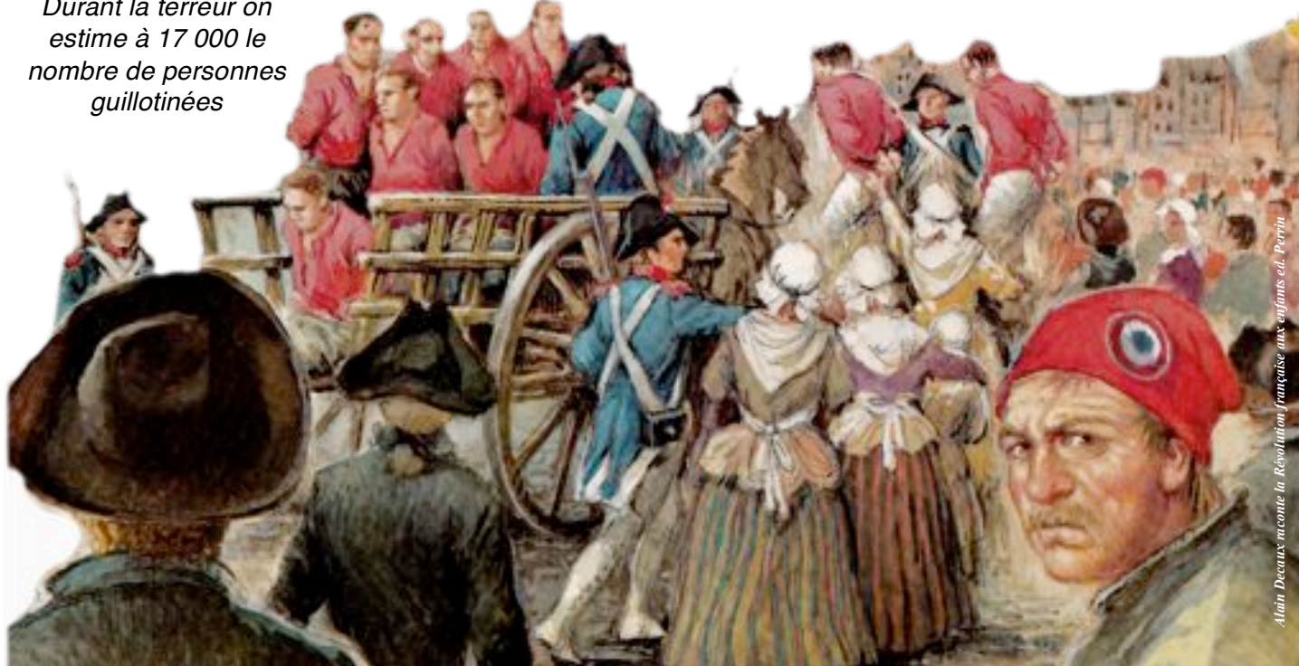
Alain Decaux raconte la Révolution française aux enfants éd. Perrin

Durant la terreur on estime à 17 000 le nombre de personnes guillotines