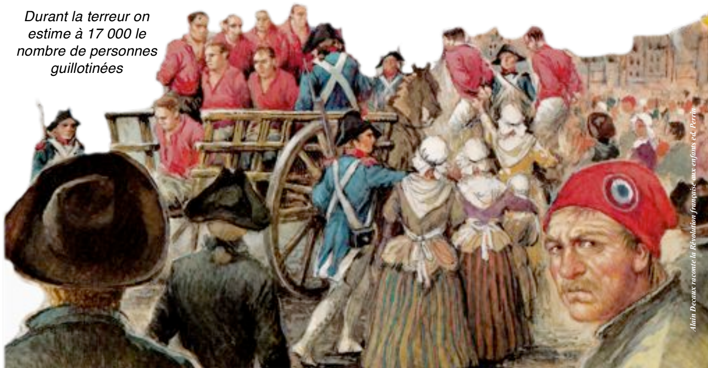
Alain Decaux raconte la Révolution française aux enfants ed. Perrin

Durant la terreur on estime à 17 000 le nombre de personnes guilloténées