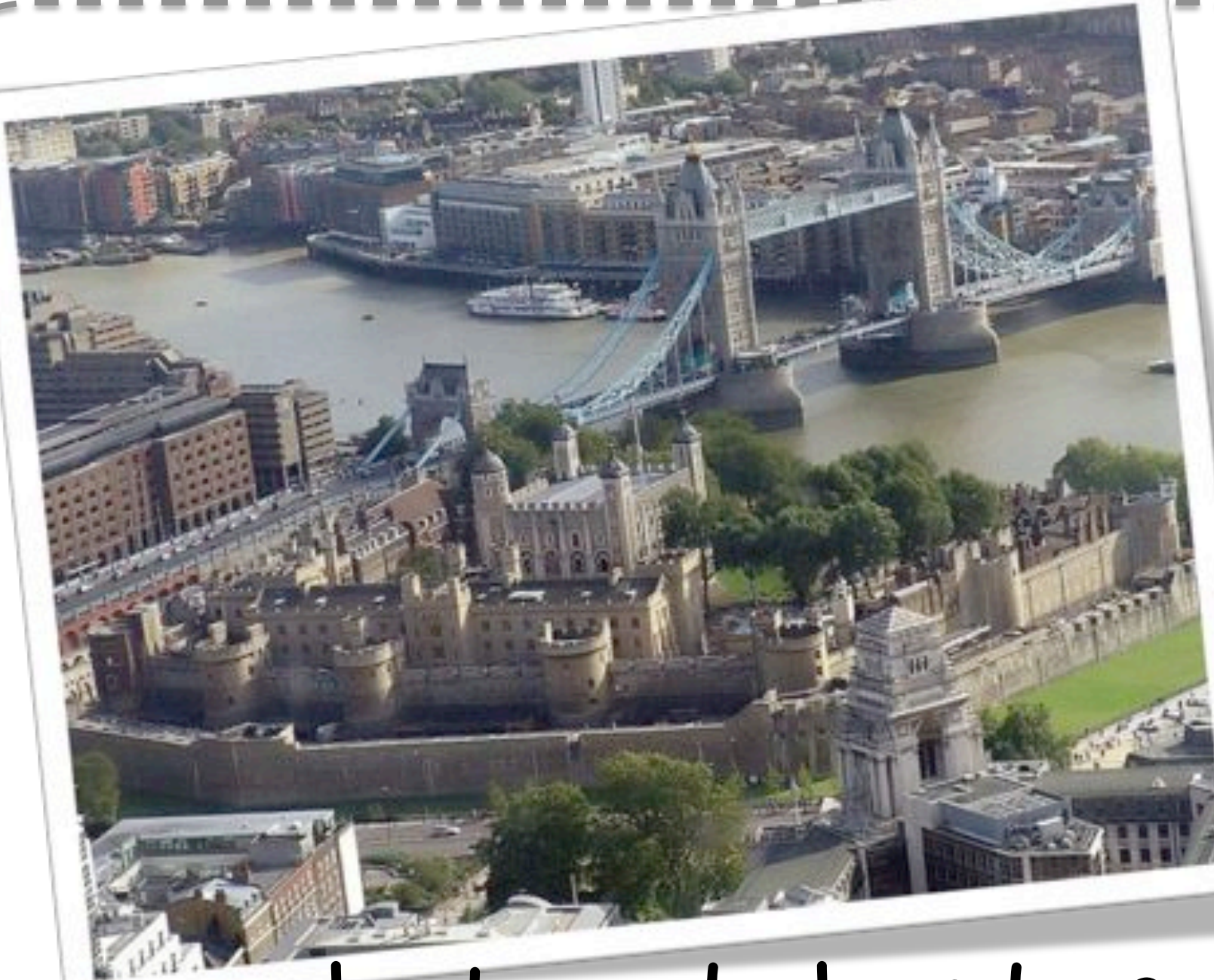
La tour de Londres