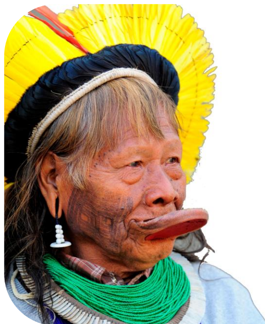
un indien d'Amazonie